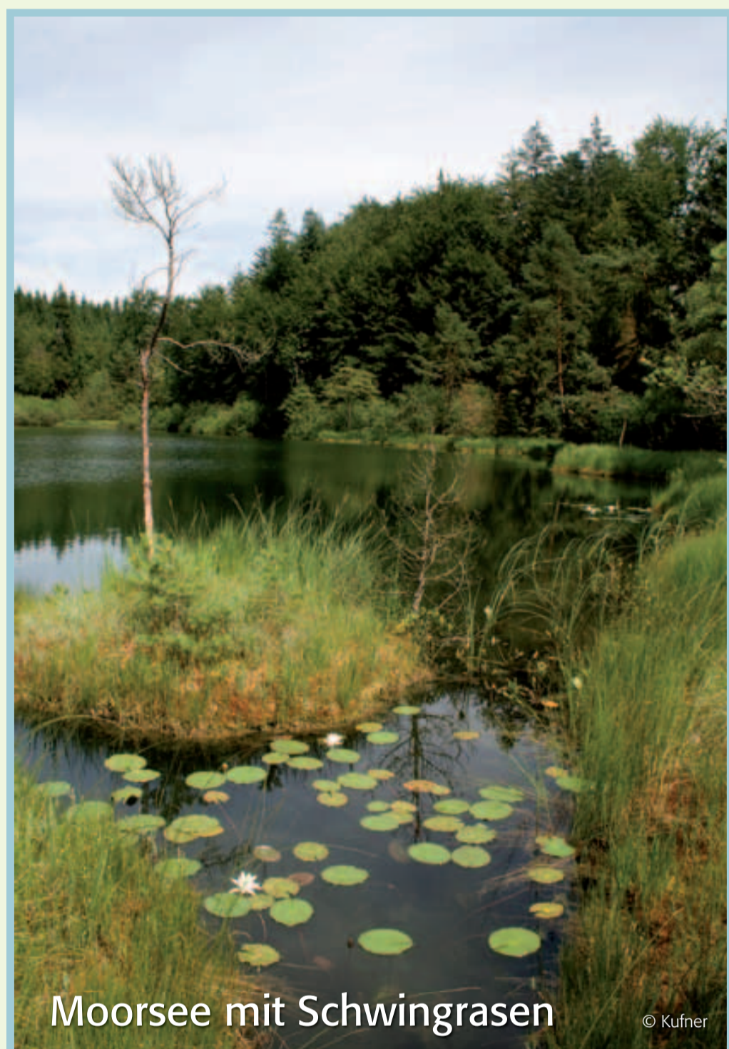
Mooresee mit Schwingrasen